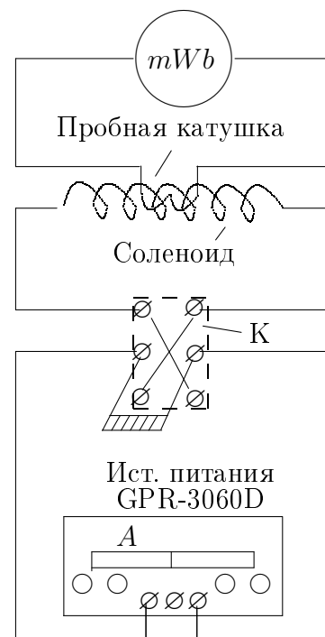
Рис. 1. Схема установки для измерений e/m методом магнитной фокусировки

Магнитное поле в соленоиде создаётся постоянным током (рис. 1), сила которого регулируется ручками источника питания и измеряется амперметром A источника. Ключ K служит для изменения направления поля в соленоиде.