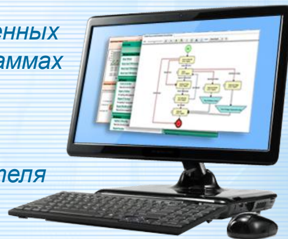
Платежная система магазина